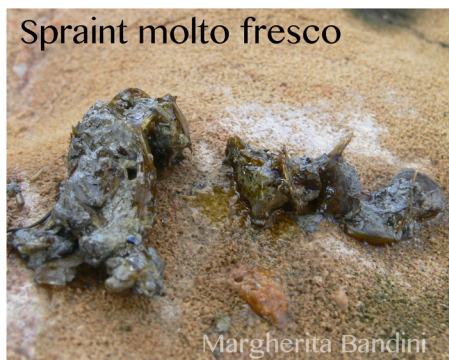
Spraint molto fresco