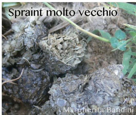
Spraint molto vecchio

Bisogna fare attenzione quando lo spraint ci sembra strano in quanto la somiglianza con quello di altri mustelidi ci può trarre in inganno - per distinguerli bisogna ricordare che l'escremento di martora o visone è ben formato, il contenuto completamente digerito e l'odore è acre e forte.