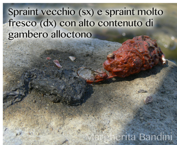
Spraint vecchio (sx) e spraint molto fresco (dx) con alto contenuto di gambero alloctono